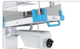
气弹簧调节床斜度