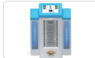
进口远红外陶瓷加热器